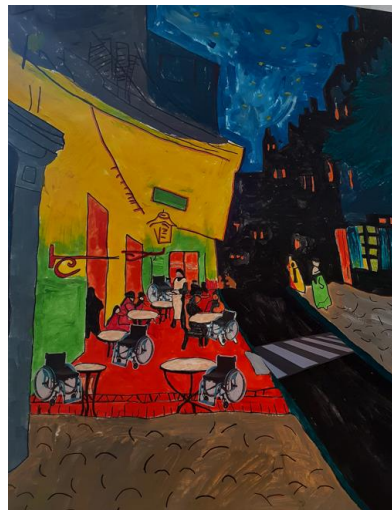
Ecole Van Gogh (Magny)