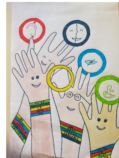
Ecole Louis Pergaud (Borny)