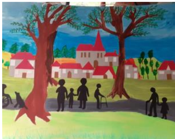
Ecole Jules Verne (Borny)