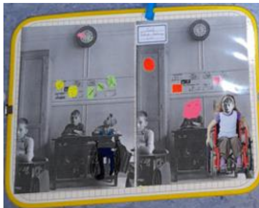
Ecole Debussy (Centre-ville)