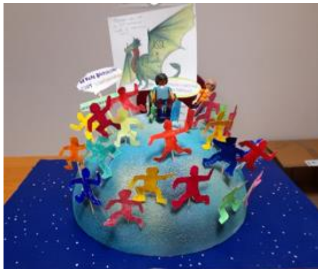
Ecole Le Graouilly (Sablon)