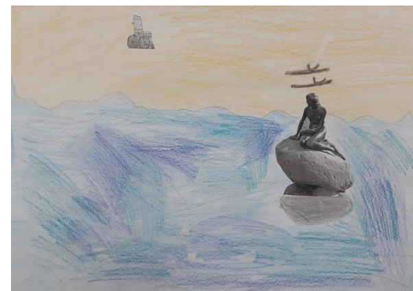
Ecole Plantières (Plantières)